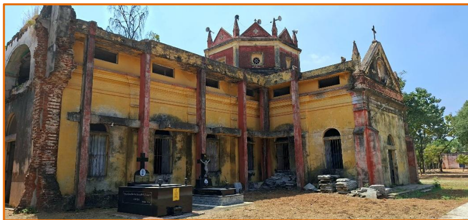
Bilder Seite 49 + 50: Kirche St. Joseph von Pater Paul

Kath. Kirchengemeinde St. Lambertus IBAN: DE66 4006 9601 0011 3312 10 Verwendungszweck: St. Joseph, Indien (Eine Spendenbescheinigung wird auf Wunsch ausgestellt!)