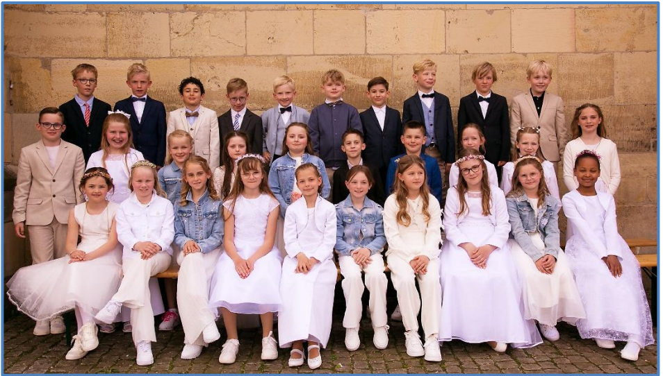
Erstkommunionkinder 02.05.2026, St. Lambertus, Ascheberg