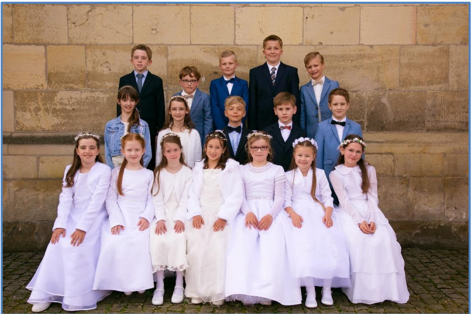
Erstkommunionkinder 03.05.2026, St. Lambertus, Ascheberg