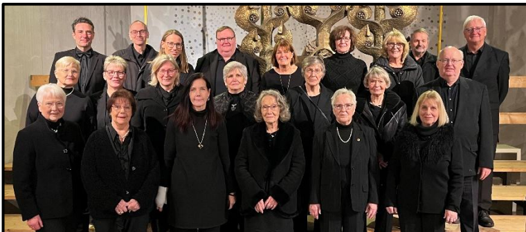
Kirchenchor St. Benedikt