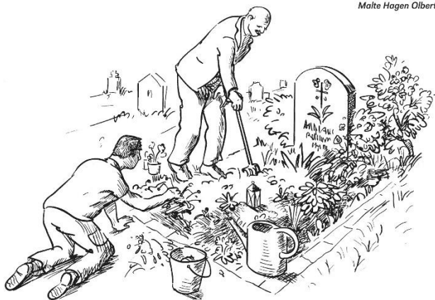
Malte Hagen Olbertz

Die schlichten Holzkreuze mit dem Namen der verstorbenen Personen aus St. Lambertus in Ascheberg mit dem Geburts- und Sterbedatum liegen rund um diesen Feiertag hinten in der Werktagkapelle der St. Lambertus-Kirche aus. Dort können sie gerne von den Hinterbliebenen bis zum 07.11.24 mitgenommen werden, um zuhause noch persönlich Trost zu spenden. Nicht abgeholte Kreuze werden ab dem 11.11.24 ins Pfarrbüro gegeben, wo sie bis zum Jahresende 2024 zu den Öffnungszeiten abgeholt werden können.