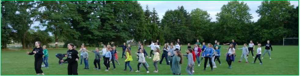
Foto: Kinder und Betreuer üben gemeinsam den diesjährigen Lagertanz, der den Eltern bei der Ankunft in Ascheberg vorgeführt wurde.

Nachdem das Ministrantenferienlager der Pfarrgemeinde St. Lambertus Ascheberg zwei Jahre lang aufgrund der Corona-Pandemie pausieren musste, war es dieses Jahr endlich wieder so weit: Vom 10. – 24. Juli machten sich knapp 50 Kinder gemeinsam mit 15 Betreuern und einem 5-köpfigen Kochteam auf den Weg nach Neustadt an der Weinstraße, um dort 2 Wochen voller Spiel, Spaß und Spannung zu genießen.